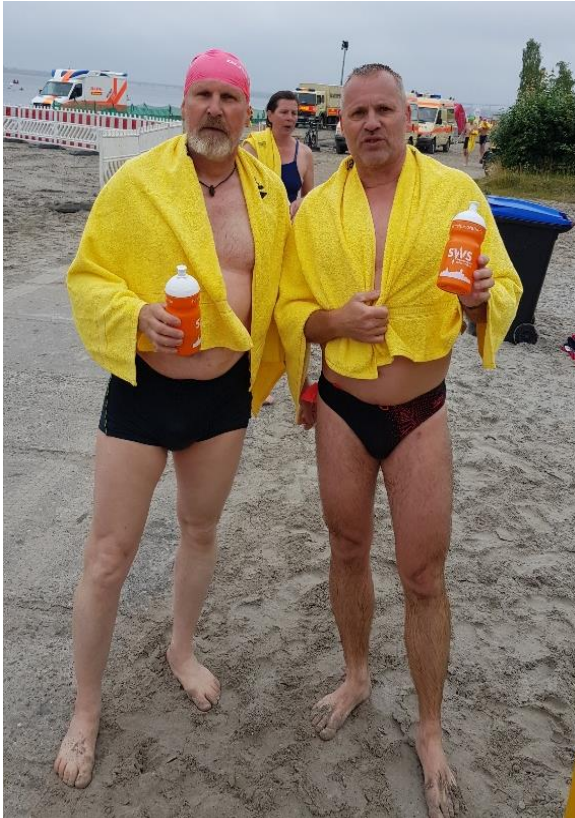
Wolf in Siegerpose 😊 Glückwunsch!