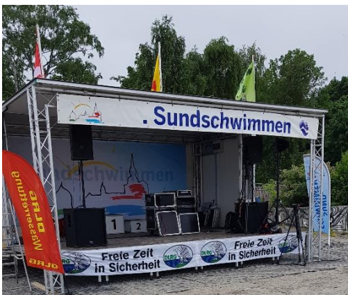
Das Siegetrepptchen Haus