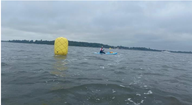
Absicherung zu Wasser...