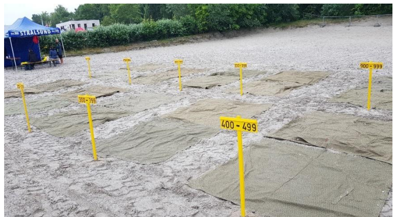
Mein Arbeitsplatz am Sund Schwimmer Tag...Gepäckrückgabe!