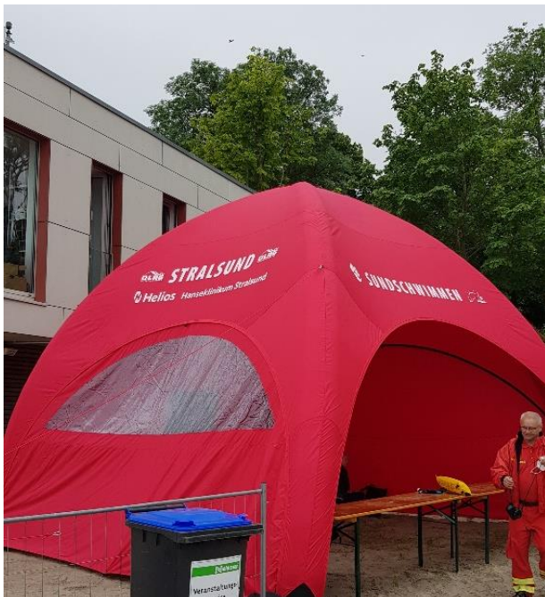
Das Info Zelt

Es ist der 3.7.2021 man schaut aus dem Fenster und erwartet eigentlich einen herrlichen Sommertag. Aber wie die Jahre zuvor beherrschen Nieselregen, Wind und schlechte Sicht den Sundschwimmen-Tag. Die Außentemperaturen allerdings sind in Ordnung. Auch die Wassertemperatur von 21 Grad (gemessen im Strandbad) sollte kein Problem für die heutigen mutigen 496 Schwimmer werden. Die zu schwimmende Strecke beträgt 2,3 km. Der Kurs ist einfach, wenn er denn wie gewohnt stattfindet. Eine Schwimmstraße aus gelben Bojen wurde schon am Vortag gelegt. Diesmal ist tatsächlich Altefähr wieder Startpunkt für die Überquerung des Strelasunds. Die Jahre 2018 und 2019 war Parow als Ausweichstartpunkt ausgewählt worden um der Witterung (Wind, Strömung) möglichst zu entgehen. Dafür war das Wasser arschkalt, sodass viele das Ziel nicht erreichten, auch weil der Veranstalter das nicht mehr verantworten konnte und wollte. Das Jahr 2020 war Corona bedingt abgesagt worden und so gelten die Anmeldungen für das Jahr 2021.