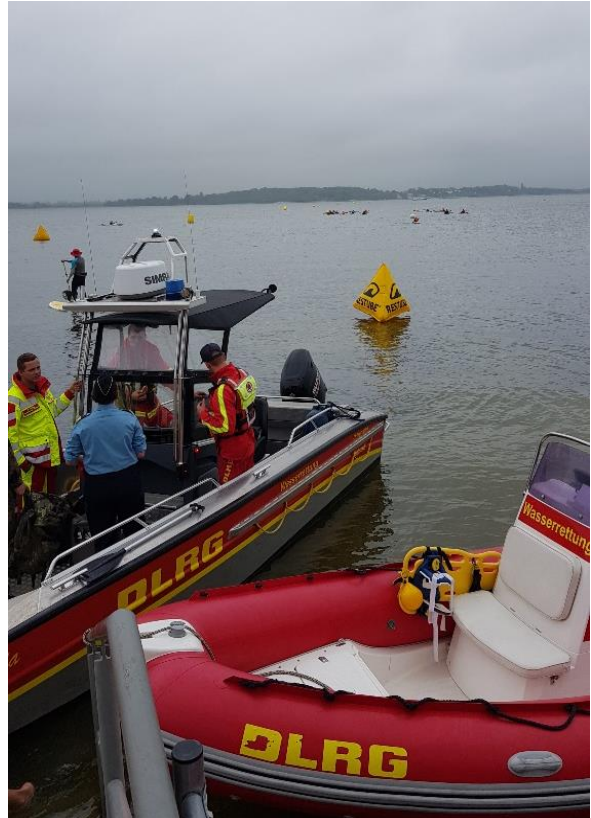
...ein Dank an die DLRG